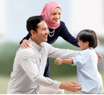
Tabel Asuransi Penyakit Kritis Asuransi Tambahan AXA Critical Care Syariah